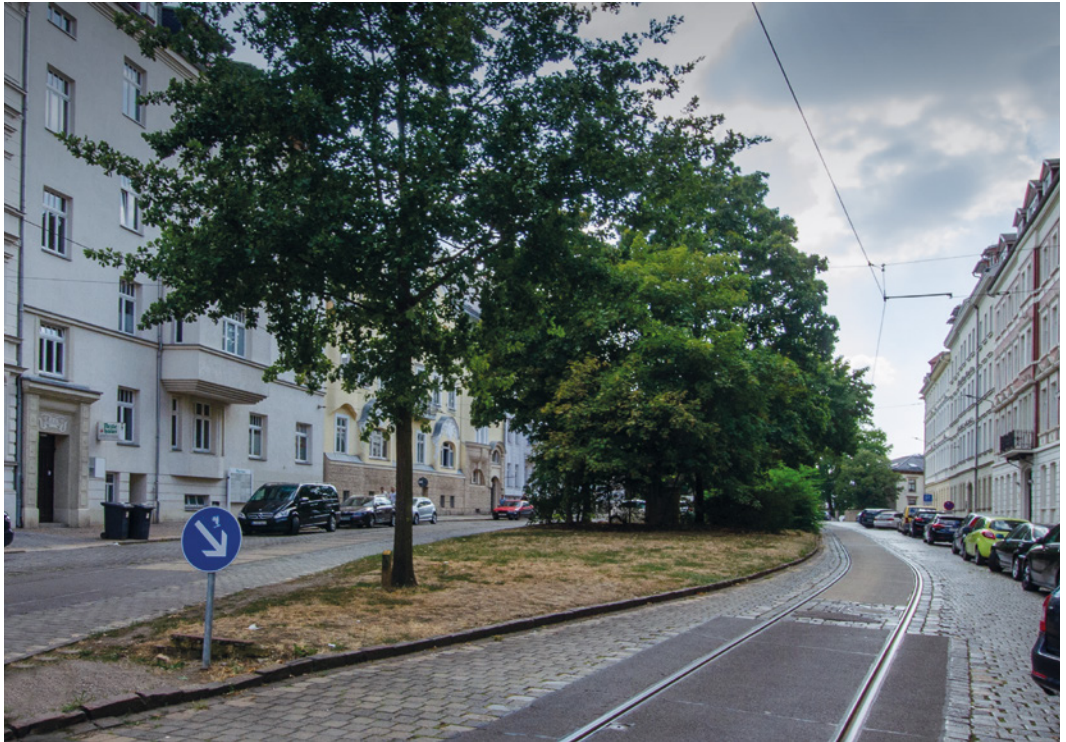
Der Gohliser Anger in der Menckestraße

chen wurde 1885 abgerissen. Da das Schulgebäude weder den Bedürfnissen des Unterrichtes noch denen einer angemessenen Lehrerwohnung genügte, wurde es 1861 für diese Zwecke aufgegeben. Dafür wurde ein neues Schulgebäude am Lindenplatz (heute Kirchplatz) errichtet.