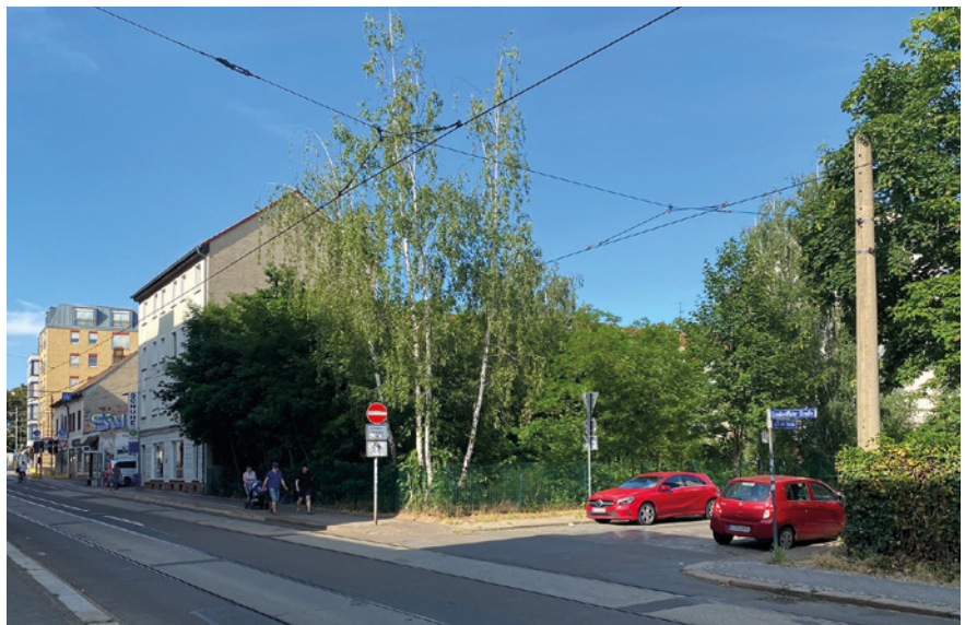
Grundstück Gothaer Straße 42 im Sommer 2021

haben sie Leipzig als besten Standort ausgewählt, und in Leipzig die Wolfener Straße 42. Die Gruppe umfasst mehrere Architekten und Künstler, aber auch jemanden, der ein Café betreiben möchte – direkt an der Stra-