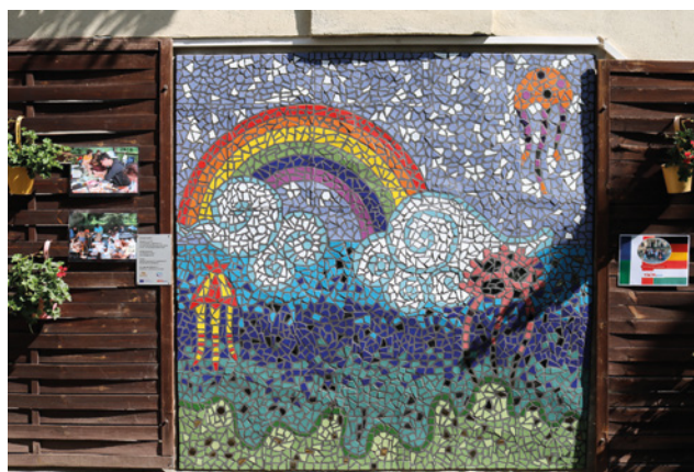
Mosaikgalerie in der Einfahrt zum Budde-Haus

Partner des Projektes waren das EU-Austauschprojekt des FAIRbund e. V., das Budde-Haus und das Berufsbildungswerk Leipzig. Finanziert wurde es durch den Europäischen Solidaritätskorps und die Deutsche Organisation für Mosaikkunst e. V. (DOMO). In den nächsten zwei Jahren sollen zwei weitere Mosaik- die Galerie vervollständigen.