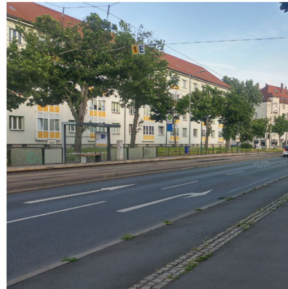
Landsberger Straße Richtung Viertelsweg

Im Zuge der Bauarbeiten gibt es für den Fußverkehr einige Verbesserungen in Sachen Barrierefreiheit. An den Einmündungen fast aller Nebenstraßen werden Gehwegvorstreckungen angelegt, die das Überqueren erleichtern und für die Verlangsamung des abbiegenden Kfz-Verkehr sorgen. Dort sowie an den Ampelanlagen und Haltestellen werden Bodenleitsysteme installiert. Außerdem sollen Poller und Radbügel an den Gehwegnasen errichtet werden, damit Querungshilfen und Sichtachsen für den fließenden Verkehr frei bleiben.