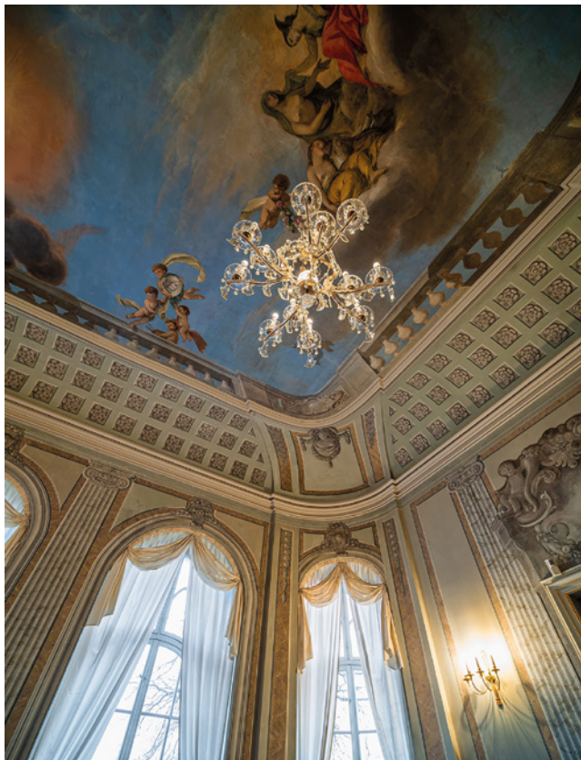
Blick ins Schlösschen – Ein Ausschnitt der Plafondausmalung im Oesersaal

Schlösschen lässt sich wieder erkunden - interessierte Besucherinnen und Besucher können an geführten Rundgängen durch die prächtigen